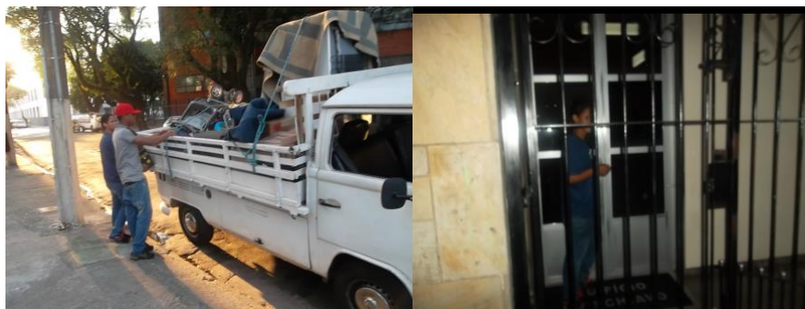
A SAÍDA DA CASA ANTIGA

proximidades do Projeto, para que assim não tenham que interromper os programas e projetos em que estão inseridas, pela dificuldade de cuidar de seus filhos e ainda terem que enfrentar longas horas dentro dos transportes públicos por morarem longe.